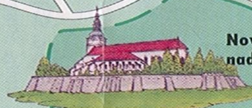
Kostol Narodenia Panny Márie Nové Mesto nad Váhom